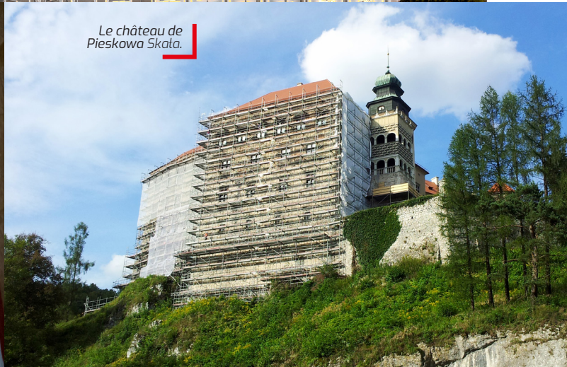
Le château de Pieskowa Skata.