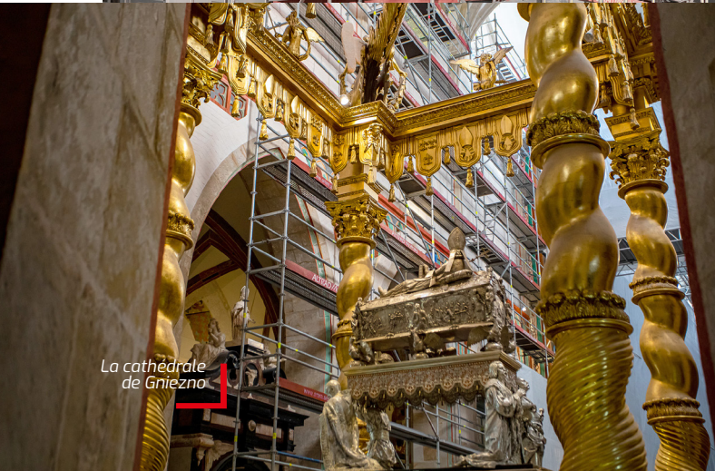
La cathédrale de Gniezno